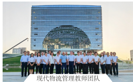
现代物流管理教师团队