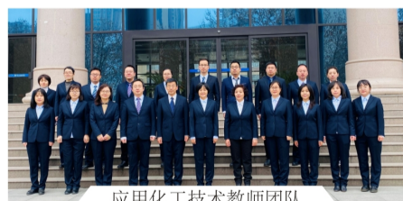
应用化工技术教师团队