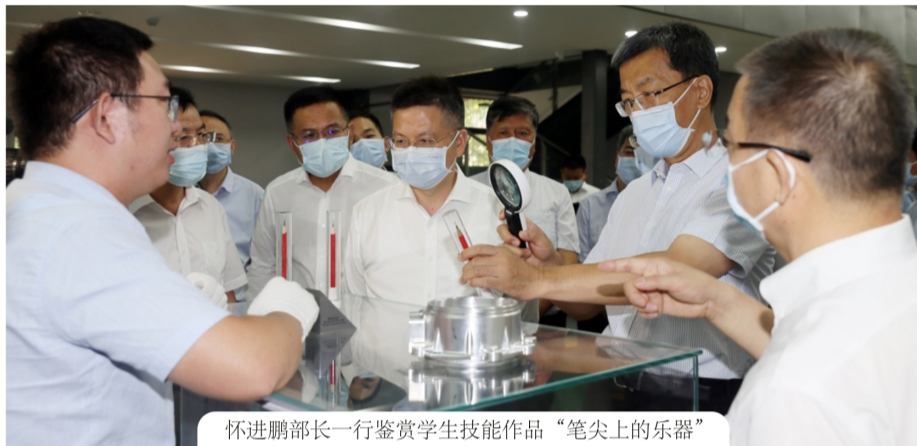
怀进鹏部长一行鉴赏学生技能作品“笔尖上的乐器”

在5G+智能成型实训基地，怀进鹏部长详细了解学校与宁夏共享共建的精密铸造实训中心建设情况，观看了“5G+、3D打印、智能控制等新技术+绿色智能”先进实训场景，查看了焊接、模具、增材、钛铝合金、精密铸造、柔性玻璃等产品展示，对职业教育产教融